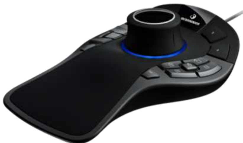
Рисунок 1 – Пример 3D-манипулятора

3D-манипулятор SpaceMouse Pro или аналог (см. рисунок 1)